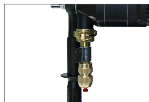
Connexion rapide à l'eau